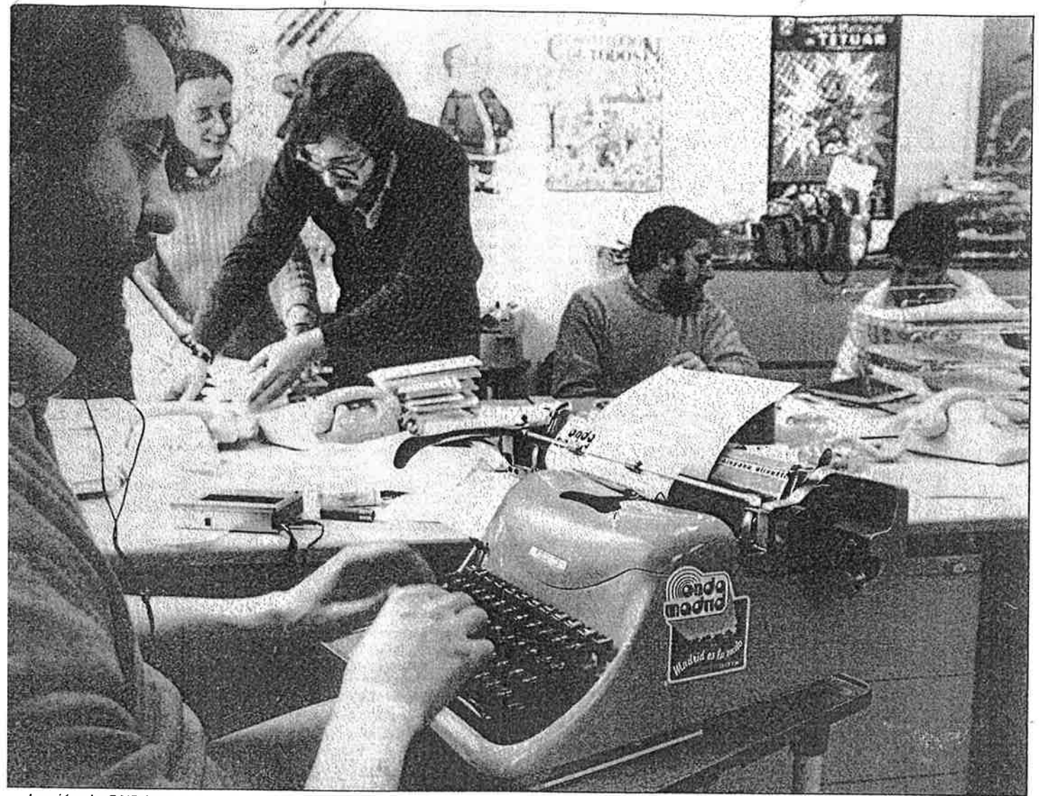
redacción de ONDA MADRID efectuará un seguimiento permanente de la actualidad en todo el ámbito regional, tanto desde los estudios como a través de las unidades móviles y vehículos con radio-teléfono de que dispone la emisora